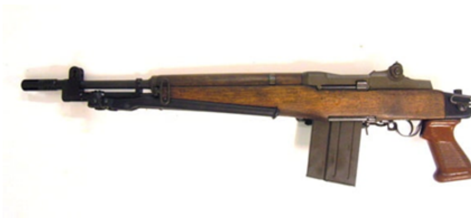
Nuova Jager BM99: variante civile NON AMMESSA