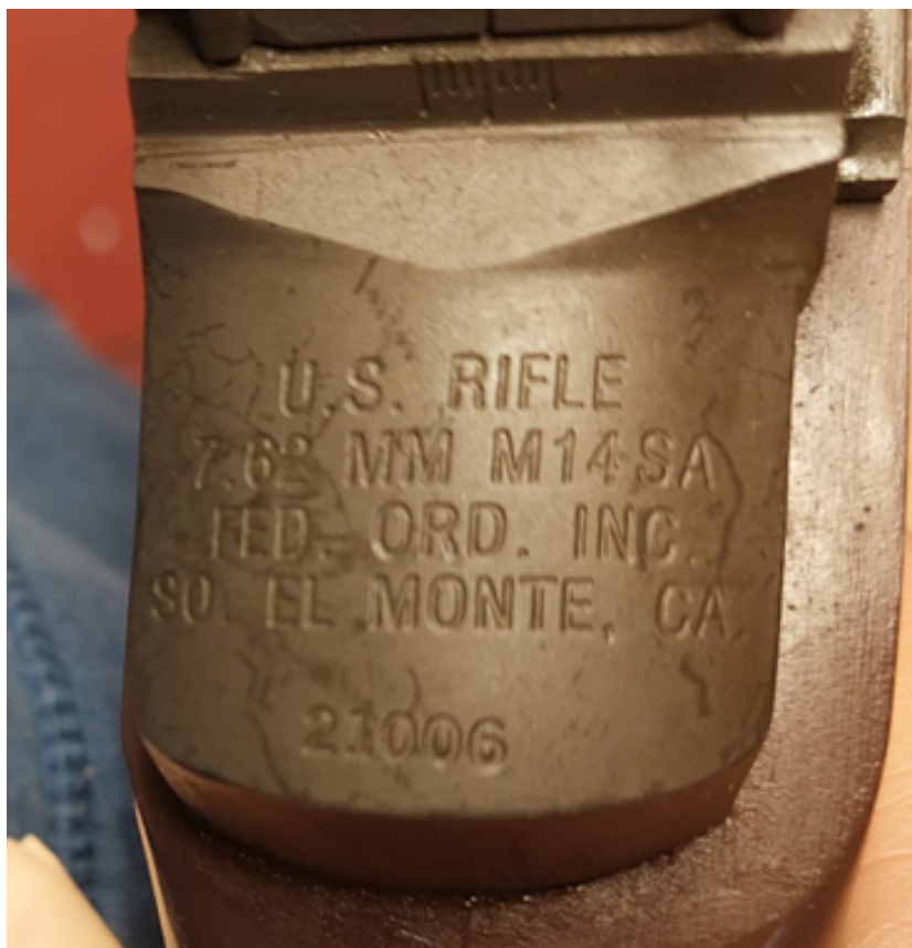
FEDERAL ORDNANCE: NON AMMESSO