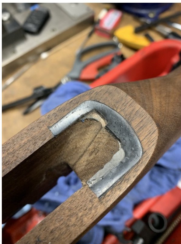
IMMAGINE 3: Applicazione della resina epossidica nel punto di appoggio posteriore dell'azione