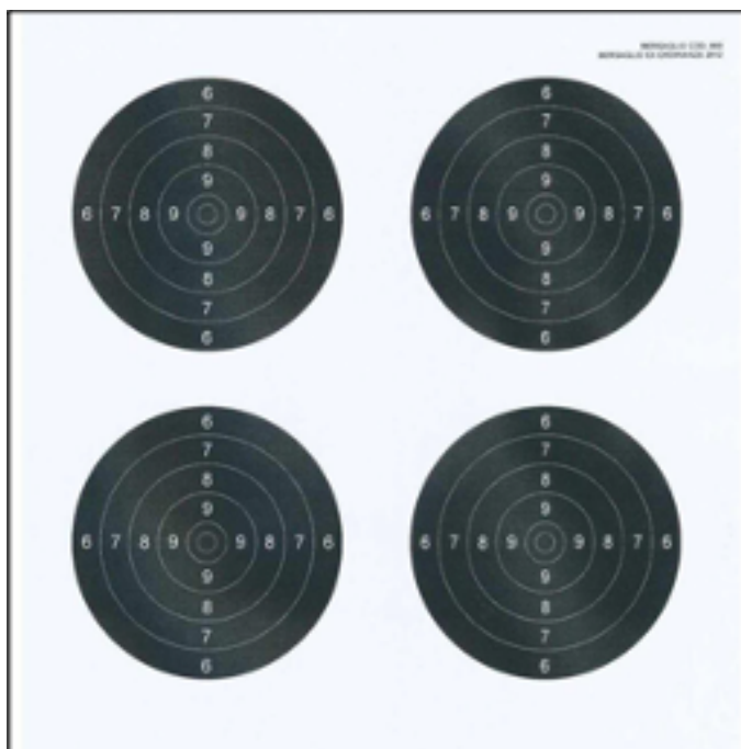
Ex Ordinanza 100 Metri: Ottica