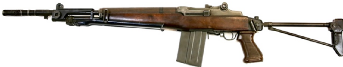
BM59 "ITAL-TA": variante AMMESSA