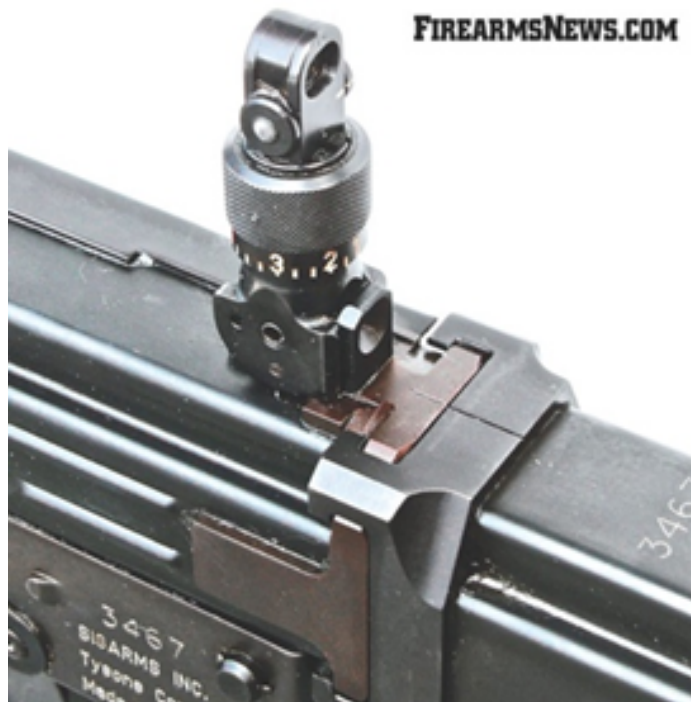
Dietro regolamentare Stgw57 AMMESSA