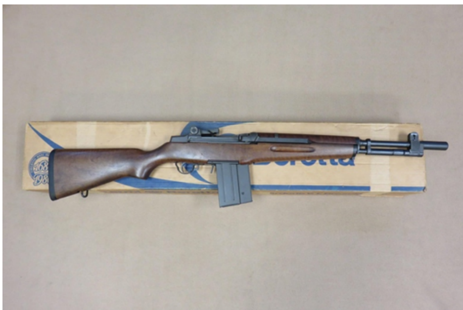
Beretta BM62: variante civile NON AMMESSA