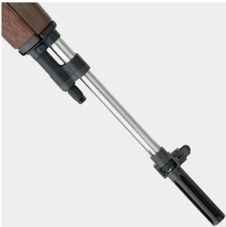
Canna tipo MATCH/SUPERMATCH in acciaio inossidabile cromato NON AMMESSA.