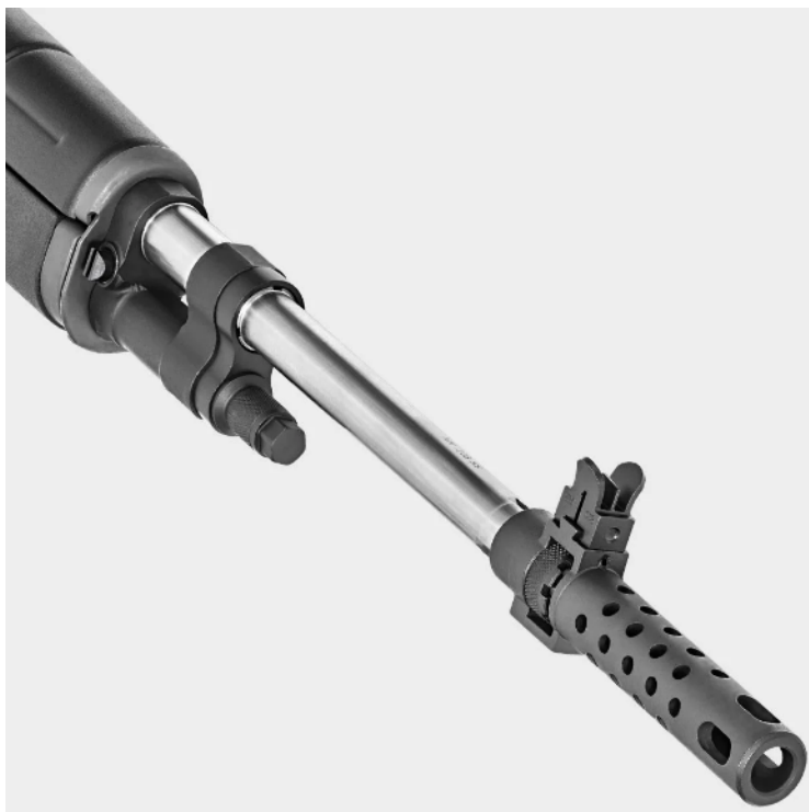
Altro esempio di canna cromata MATCH/SUPERMATCH con freno di bocca traforato NON AMMESSO