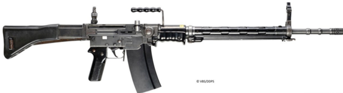
STGW-57: configurazione militare AMMESSA

Sono ammessi gli STGW57 svizzeri purchè di ordinanza svizzera calibro 7,5x55 swiss (non sono ammessi i Sig Amt910 e 510) come indicato a nel capitolo Specialità Semiautomatico del regolamento.