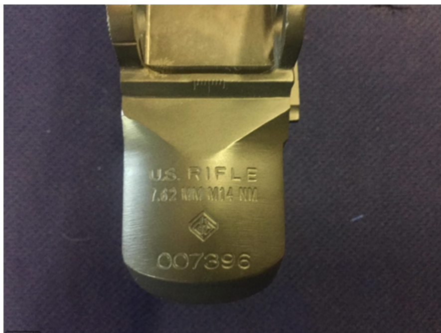
NATIONAL MATCH: NON AMMESSO