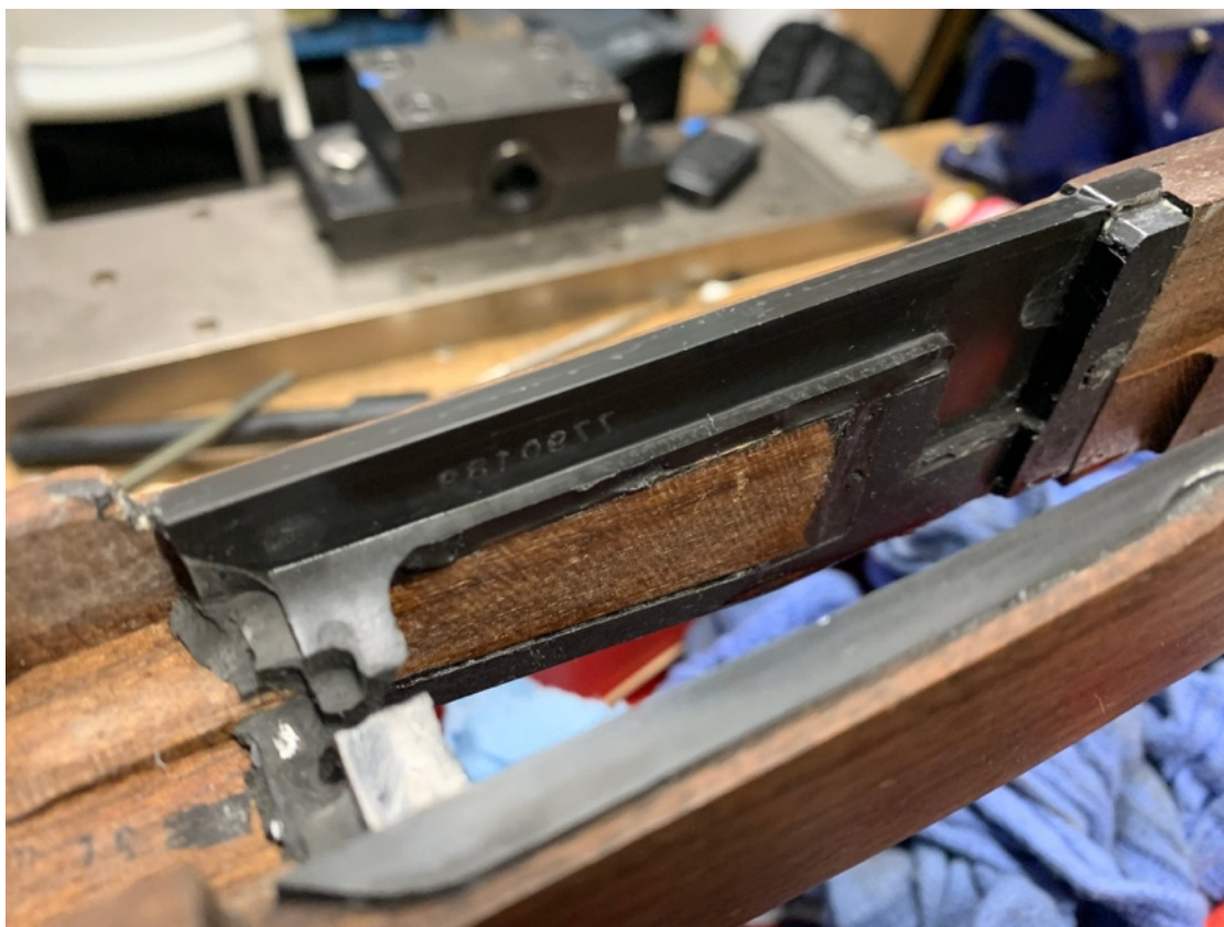
IMMAGINE 2: Separando la calciatura dall'azione si può vedere lo strato di resina epossidica nei punti di contatto tra calciatura e azione.