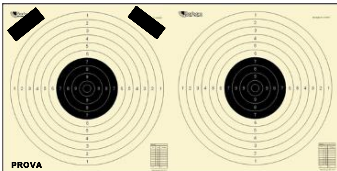
Ex Ordinanza 100 Metri: MIRE METALLICHE E SEMIAUTOMATICO